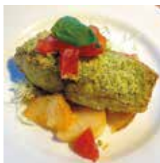
サワラの香草パン粉焼き