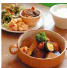
本日の煮込み料理

ディナーボックス 1000円ディナーボックス 1050円ディナーボックス 1000円ディナーボックス 1200円 デリセット1450円単品850円 デリセット1500円単品900円 デリセット1450円単品850円 デリセット1650円単品1050円