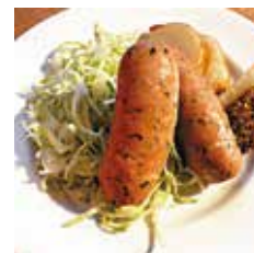
自家製ハーブソーセージ

ディナーボックス 950円ディナーボックス 950円ディナーボックス 1000円ディナーボックス 1000円 デリセット1400円単品800円 デリセット1400円単品800円 デリセット1450円単品850円 デリセット1450円単品850円