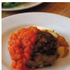
ハンバーグステーキ

○オードブル、盛り合わせ、パーティー用など もご用意しておりますのでお問い合わせ下さい。