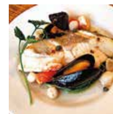
スズキのアクアパッツァ

ディナーボックス 1000円ディナーボックス 950円ディナーボックス 1050円ディナーボックス 1300円 デリセット1450円単品850円 デリセット1400円単品800円 デリセット1500円単品900円 デリセット1750円単品1150円