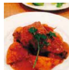
牛肉の赤ワイン煮込み

ディナーボックス 1000円ディナーボックス 1050円ディナーボックス 1000円ディナーボックス 1200円 デリセット1450円単品850円 デリセット1500円単品900円 デリセット1450円単品850円 デリセット1650円単品1050円