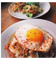
豚ひき肉のガパオご飯セット 950円 単品450円