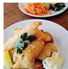
フィッシュアンドチップス