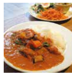
バターチキンカレーセット 1050円 単品550円