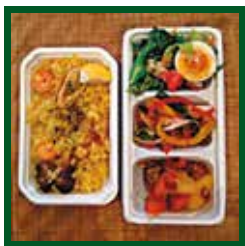
デリセット 11:00 ~ 19:30