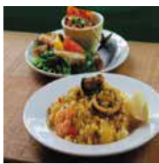
魚介のパエリアセット 920円 単品420円