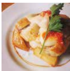
チキンのチーズ焼き

ディナーボックス 950円ディナーボックス 950円ディナーボックス 1000円ディナーボックス 1000円 デリセット1400円単品800円 デリセット1400円単品800円 デリセット1450円単品850円 デリセット1450円単品850円