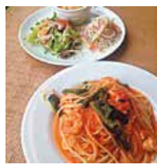
本日のパスタセット 1200円 単品700円