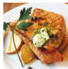
サーモンのムニエル