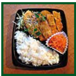
ディナーボックス 15:00 ~ 19:30

ライス、デリ一品、野菜入りのお弁当。 デリが三品選べるデリセットもお得 しっかり食べたい晩ごはんに最適です。