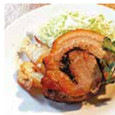
豚バラ肉のポルケッタ